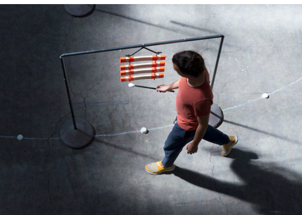
Projet Step